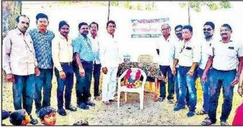
భీమారంలో సీవీ రామన్ చిత్రపటానికి నివాళులు అర్పిస్తున్న ఉపాధ్యాయులు