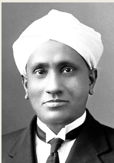
SIR CHANDRASHEKARA VENKATA RAMAN